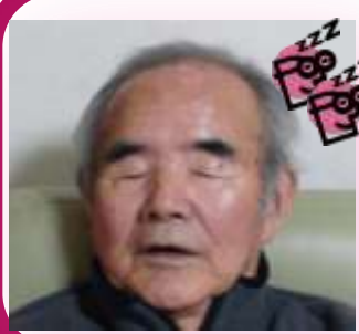
良い夢見てるで賞